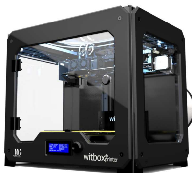
Imprimante 3d pour les projets des classes scientifiques et technologiques

Elle permet à l'établissement d'investir dans des matériels performants et de former les élèves et les étudiants avec des moyens techniques professionnels.